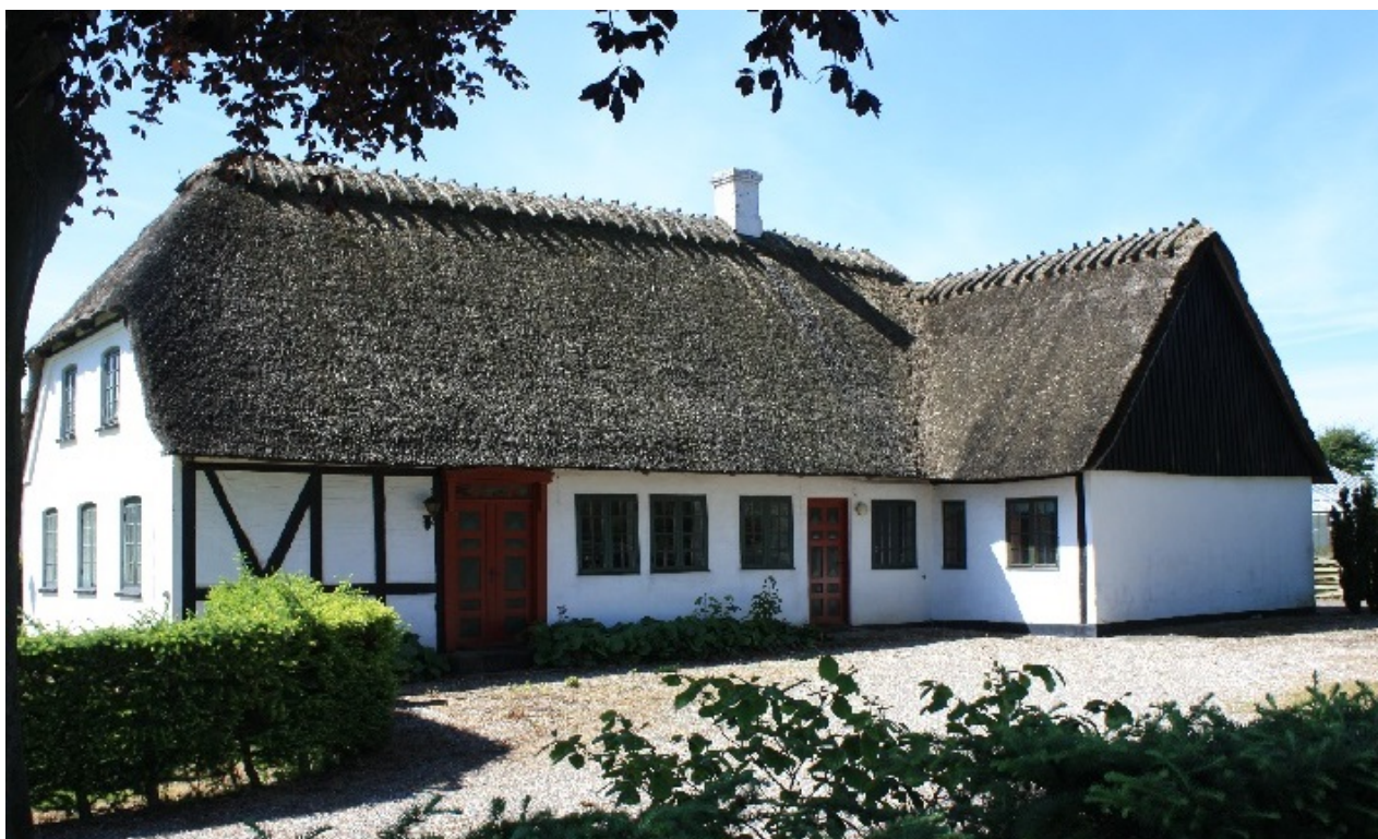
Kolds første højskole ved Ryslinge

Endelig præsenterer vi en helt ny oversigt med højskoleadresser, inddelt efter kommune (kun højskoler inden for det nuværende Danmark).